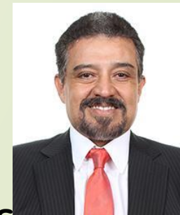
Dip. Carlos Lomeí Bolaños (COALICIÓN PRD MOVIMIENTO CIUDADANO)